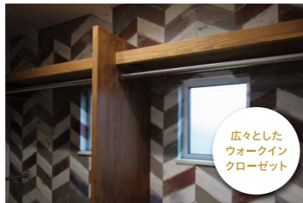
広々とした ウォークイン クローゼット