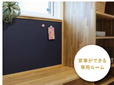
家事ができる 専用ルーム